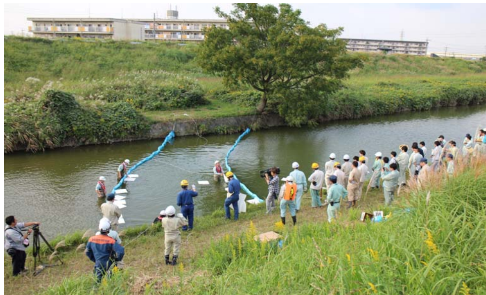
オイルフェンスの設置